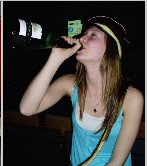
Vorming versus drank, KASPER versus Vereniging X, ieder zijn specialiteit zullen we maar zeggen?